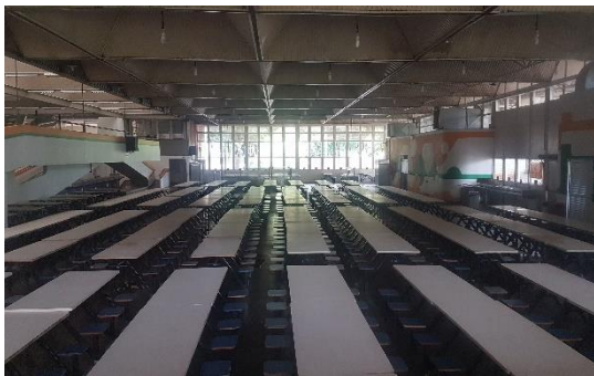
Mensa der Universität

Ich kann Brasilien wirklich jedem sehr empfehlen, auch wenn es mich beruflich nicht unbedingt voran gebracht hat, hatte ich eine super schöne Zeit mit vielen neuen Eindrücken und Erfahrungen.